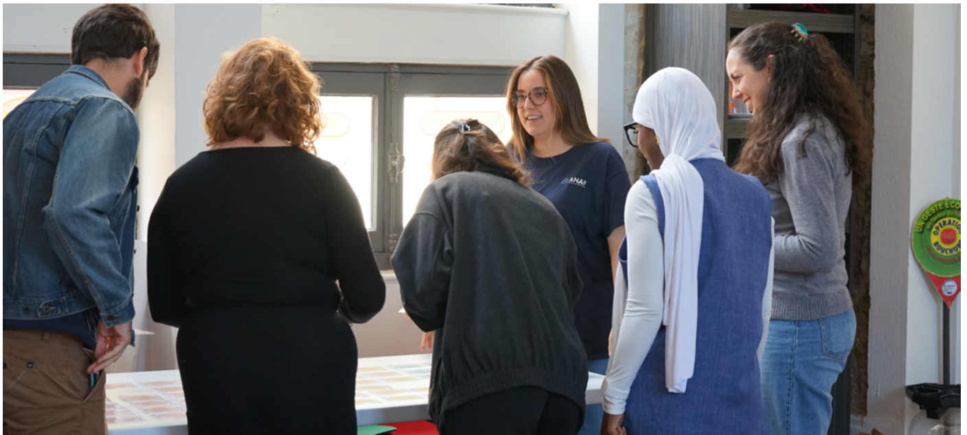
Étape à Lyon 2025