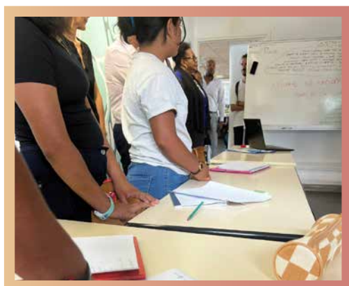
Élèves en séance

Sérieux, assidus et attentifs, malgré des parcours personnels parfois compliqués, ces jeunes font preuve d'une réelle détermination à réussir. Au sein de ce dispositif, ils apprennent peu à peu à reconnaître leur valeur et à prendre confiance en leurs capacités. Il leur manquait simplement ce petit plus : des personnes pour croire en eux et les accompagner sur le chemin de la réussite.