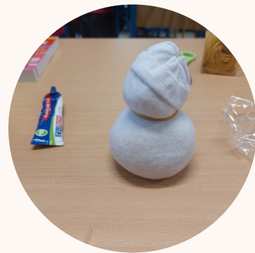
Lyne-Soraya GOIN, CM1A